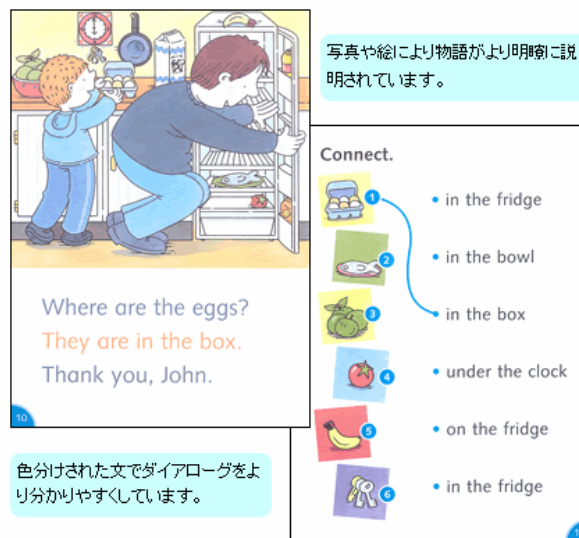
色分けされた文でダイアログをより分かりやすくしています。

下のレベルではダイアログは色分けされていて、より分かりやすくなっています。上のレベルでは直接話法の句読点なども導入されています。