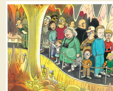
The elves put lights in the caves. The caves looked beautiful.

Q5：「Kids save island from toxic time bomb」という新聞記事を書いた記者の名前はなんでしょう？